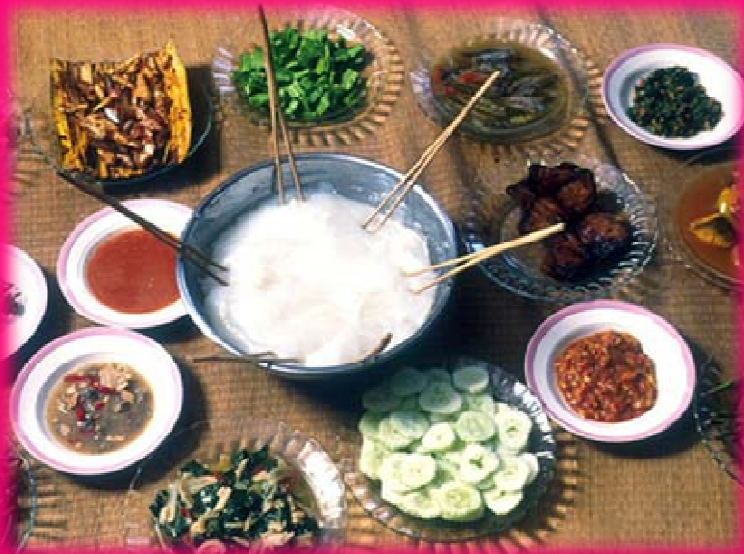
อัมบูยัต