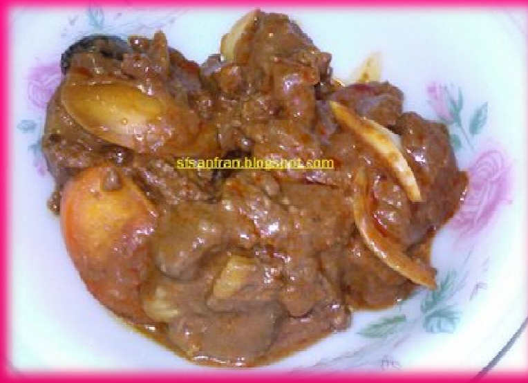
แกงเนื้อ